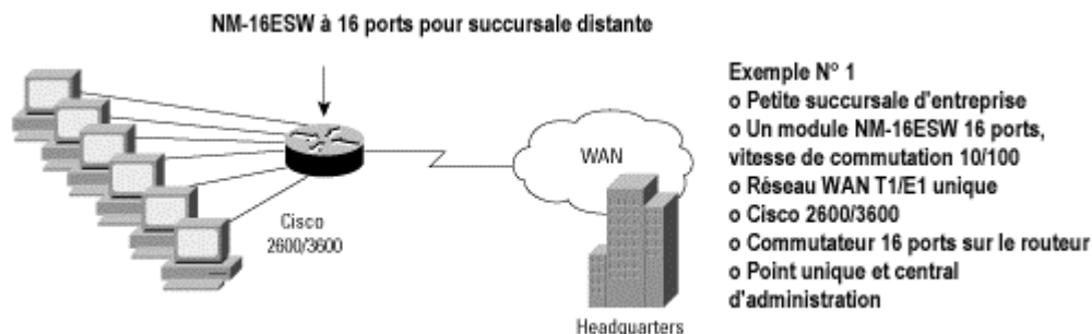
Figure 3 Déploiement classique : données seules pour petites succursales d'entreprise