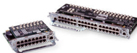
Figure 1 Modules EtherSwitch Cisco à 16 et à 36 ports

Les modules Cisco EtherSwitch 16 et 36 ports sont disponibles avec des options d'alimentation par le câble réseau « Inline Power » et le support du Gigabit Ethernet. Pour faciliter l'installation, nous proposons également des ensembles EtherSwitch avec des options préinstallées. L'alimentation par le câble réseau supporte les téléphones IP Cisco et les points d'accès AP Cisco sans fil Aironet. Pour cette fonction, une alimentation externe est nécessaire sur les plates-formes Cisco 2600 et 3600. Les routeurs de la gamme Cisco 3700 peuvent être équipés d'une alimentation interne.