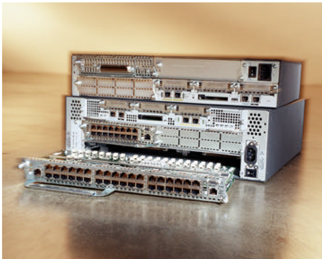
Figure 2 Routeurs Cisco 3725 et 3745 avec modules EtherSwitch